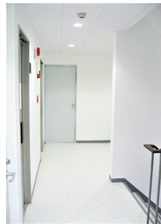
白を基調とした 明るく清潔感のある共用部