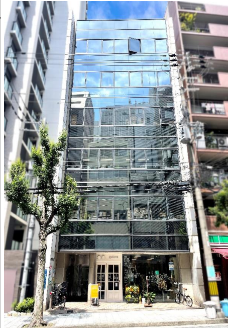
1F美容室の華やかなオフィスビル 隣の建物には100円ローソンが入っています♪