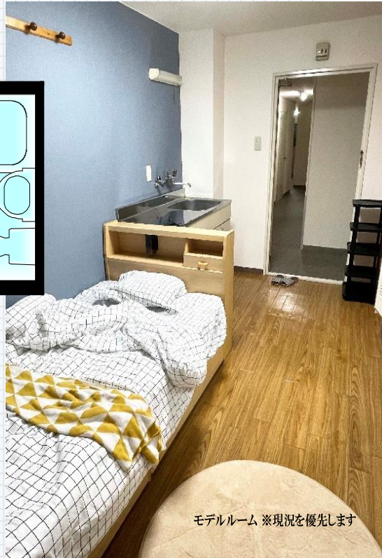
モデルルーム ※現況を優先します