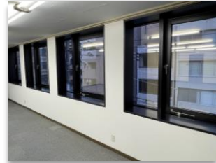
同タイプ室内 ★広々30坪★