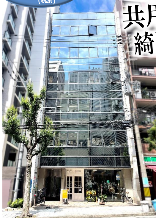
1F美容室の華やかなオフィスビル