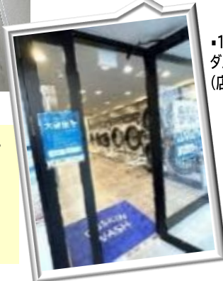
・1階はダスキンウォッシュ(店舗)です!