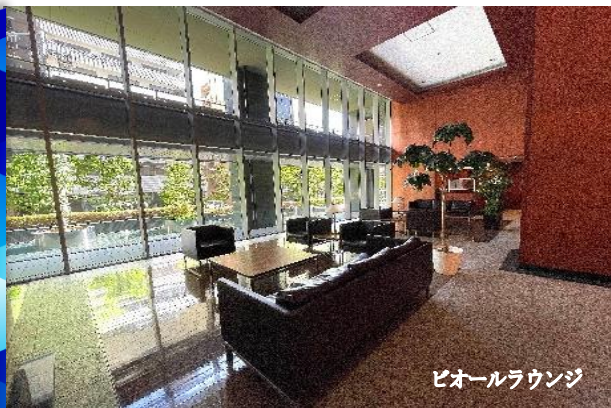
ビオールラウンジ

コンシェルジュサービス有 フィットネスルーム、ゲストルーム等、 タワーマンションならではの充実した共用設備 ※ご利用は、規約に従い別途料金が必要な場合がございます