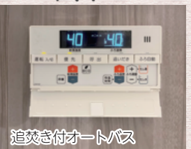
追焚き付オートバス