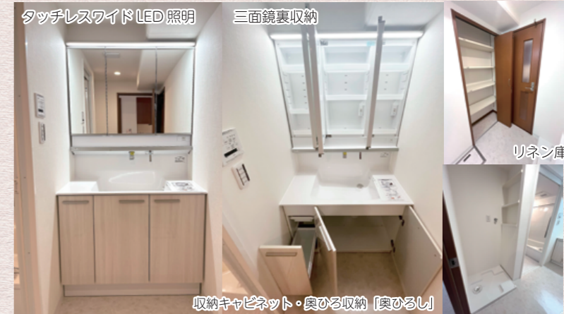
収納キャビネット・奥ひる収納「奥ひるし」