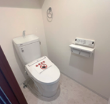
ウォッシュレット