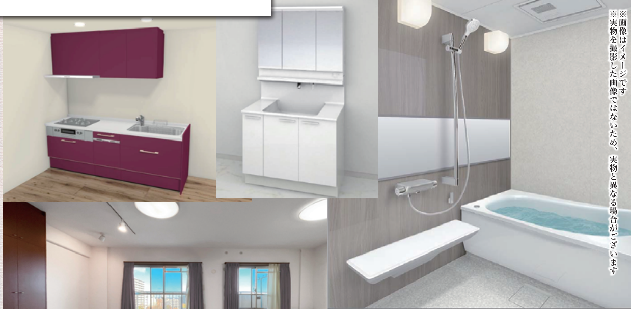
マンションリモデルWYシリーズ Kタイプ 1416 うちのお風呂は想像以上に気持ちいい スッキリ排水栓(棚W215) [シルバー] お掃除ラクラクカウンタータイプ